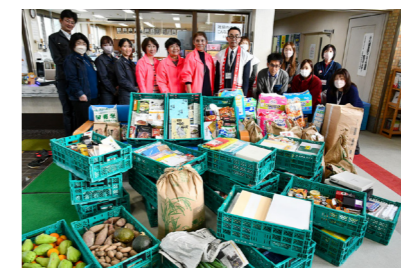
筑後市社会福祉協議会