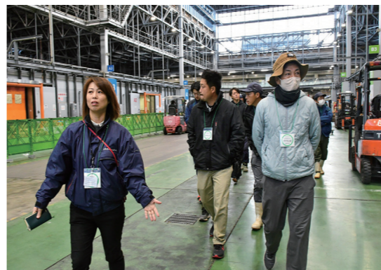
市場内を見学する研修生

JA就農支援センターは11月25日、福岡大同青果株式会社の視察研修を行い、研修生10人が参加しました。同センターのカリキュラム「流通論」の一環で、出荷してから消費者の元へ届くまでの流れを理解してもらおうと毎年実施しています。