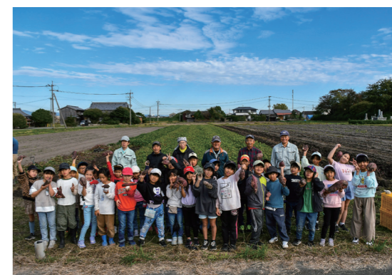
閉校前にサツマイモを収穫した児童と法人メンバー

筑後市の農事組合法人「ファーム島田」は11月20日、筑後市立古島小学校の2・3年生34人を招き、サツマイモの収穫体験を開きました。令和7年3月に閉校する同校児童の最後の思い出になればと企画しました。