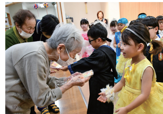
園児と交流する施設利用者

八女中央保育園の園児22人は11月20日、JAデイサービスセンター「茶と花の里」を訪問し、シンデレラの劇を披露しました。