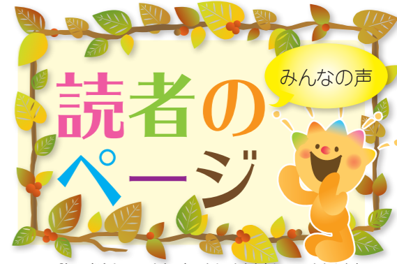
※誌面の都合上、旧八女市の方以外は八女市を省かせていただきます。

「よらん野」まで行くには少し遠いのですが、品物も良くて行くたびにたくさん買ってしまいます。これからも新鮮なおいしい果物、野菜を提供してください。