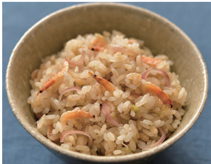
J A 愛知東女性部 (愛知県)

JA女性組織では、全国のメンバーから地域に伝わる様々な料理を募集し、JA全国女性組織協議会のホームページ等でレシピを公開しています。その中から、厳選レシピをとりまとめ、ご紹介します。