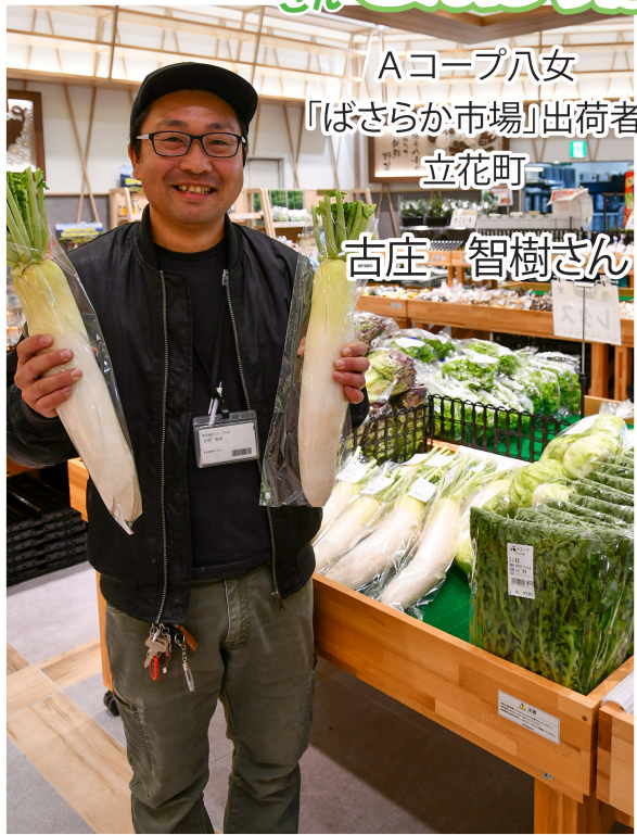
Aコープ八女 「ばさらか市場」出荷者 立花町