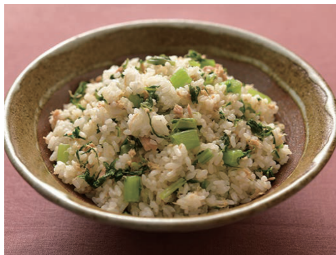
J A おきなわ女性部 (沖縄県)

チキナーの苦みやえぐみをとるために、塩もみしたらしんなりするまで置いてください。そのあと水で流し、絞ってから炒めます。ツナ缶をスパム (ポークランチョンミート) に代えたり、くるま麩を入れても彩りがよくなって good。