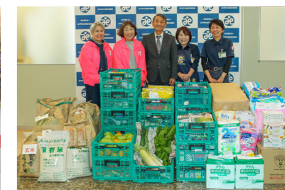
広川町社会福祉協議会