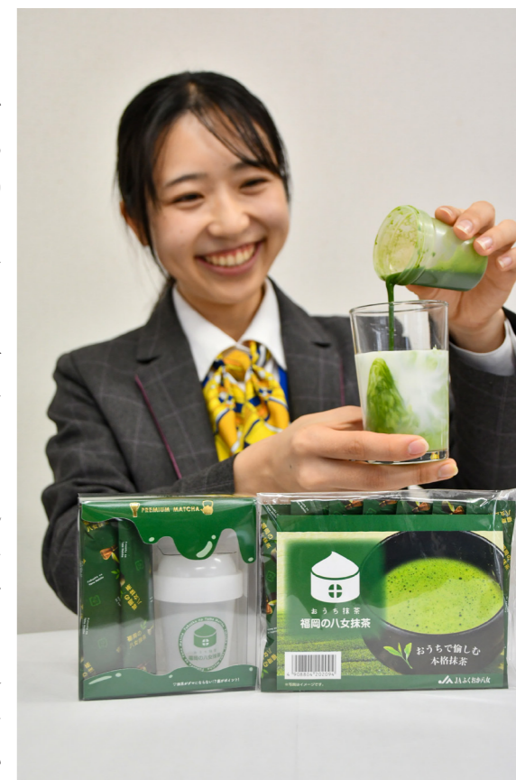
自宅で本格抹茶が楽しめる新商品の「おうちで八女抹茶」

JA茶直売所「一芯庵」やJA農産物直売所「よらん野」で販売している他、福岡県内のJA関連施設や道の駅にも随時設置予定。「一芯庵」公式オンラインショップでも取り扱っており、全国から注文が可能です。